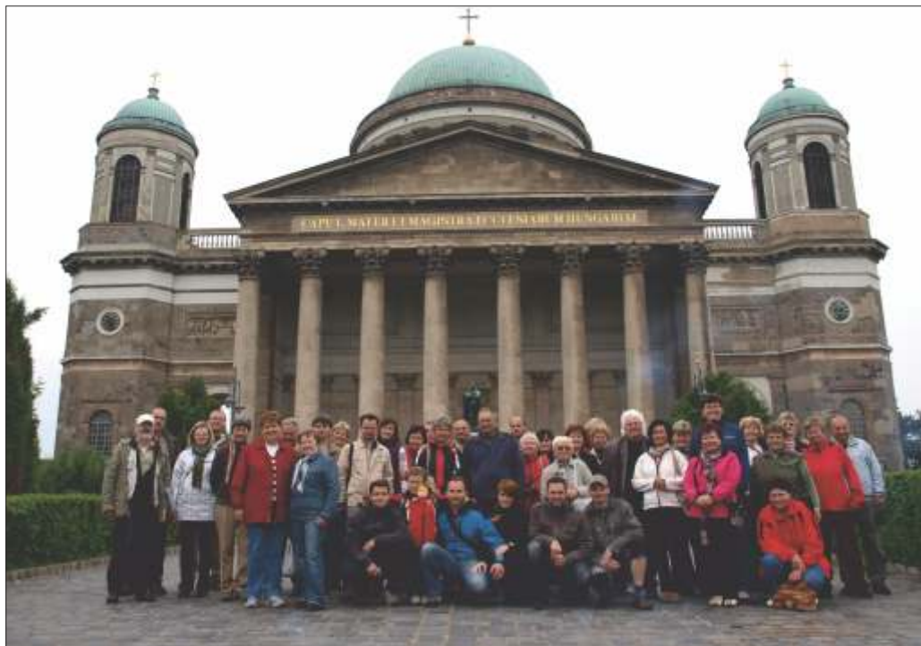
Společné foto při cestě na Ukrajinu.